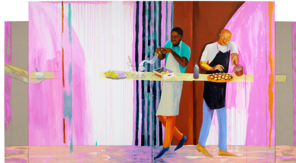
Chefs / Cuochi, 2025