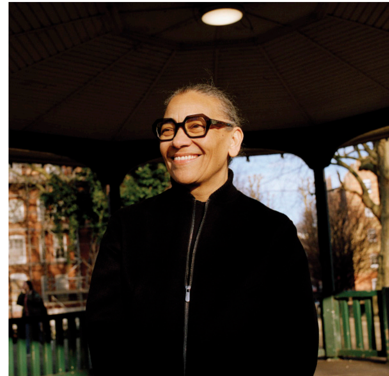
Lubaina Himid CBE RA

description towards more elusive ends. And while Can Flies Settle Here suggests intrusion or contamination, flies are essential within ecological cycles. Her questions turn the logic of contamination – redolent of colonial histories and more contemporary prejudices – back on itself, exposing how this line of thinking reduces people and natural resources to mere utilities.