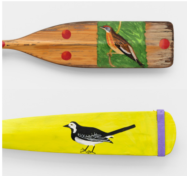
Oars (details) / Remi (particolari), 2025

[ITA] In Oars ventun remi scompagnati, su cui sono stati dipinti fiori, uccelli, talismani e forme geometriche, rivestono una parete del padiglione, evocando il passato marinaro di Venezia fatto di movimento, spostamenti e scambi. Un tempo impiegati per un fine specifico, ora hanno perso la loro funzione. Il modo in cui sono disposti richiama l’attenzione sulle presentazioni istituzionali dei manufatti come portatori fissi di significato. Per Himid la storia non è un reperto incontaminato, ma materiale da modificare e manipolare. I remi di recupero diventano superfici stratificate di memoria, resistenza e revisione.