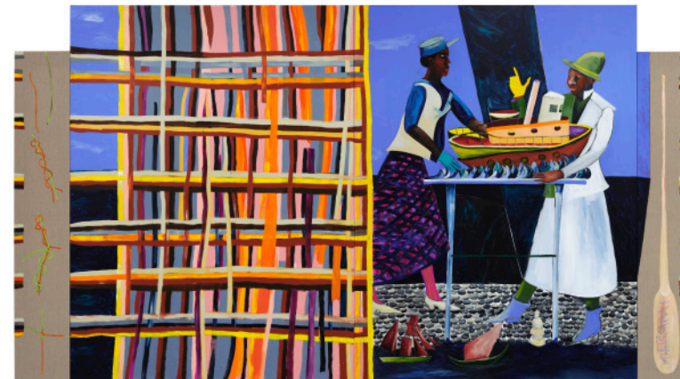
Boatbuilders / Costruttori di barche, 2025

[ITA] In Boatbuilders un campo di fili intrecciati – vernici color arancione brillante, grigio piatto e albicocca – cattura lo sguardo. La superficie intricata del dipinto richiama sia il tessuto sia le maree. Qui due personaggi ben vestiti inscenano un dibattito animato davanti al modello di una barca; sulla parete vicina, un altro volto getta lo sguardo verso la laguna di Venezia, quello del protagonista del Man in a Rope Drawer (Uomo in un cassetto di corda) di Himid. Le corde sono indispensabili per costruire le barche, per legare lo scafo all’albero, i loro nodi perfezionati nel tempo, un talento artigianale trasmesso di generazione in generazione. La trama e l’ordito del tessuto dipinto in Boatbuilders accenna al movimento sull’acqua, alla turbolenza del mare senza garanzia di approdo. Come ha detto Himid, coloro che vengono da altrove devono continuamente negoziare la loro appartenenza: decidere se integrarsi apprendendo la lingua e i comportamenti del posto nuovo o vivere con l’attrito prodotto dalla differenza.